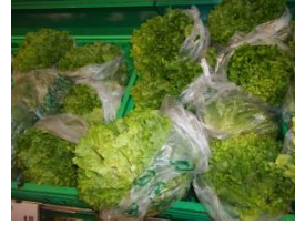
Solata, vsaka v svoji vrečki