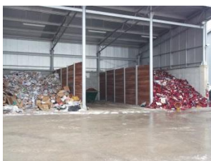
Porazdeljeni odpadki v Zbirnem centru Neža