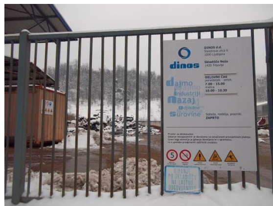
Dinos v Trbovljah

Poleg Zbirnega centra sem si ogledala tudi Dinos, družbo za pripravo sekundarnih surovin. Tudi tam so bili na svojih kupih razporejeni različni kovinski deli in ostalo.