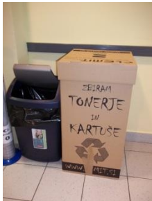
Koša za obrabljene kartuše, tonerje in baterije