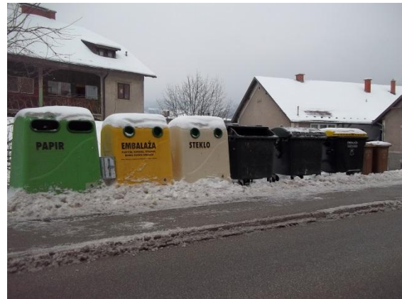
Ekološki otoček v Trbovljah

Pri vožnji skozi mesto je pri vsakem večjem stanovanjskem objektu ekološki otoček z raznovrstnimi posodami, označenimi za ločevanje odpadkov. Tudi vsaka zasebna hiša ima vsaj tri različne zabojnike za ločevanje bioloških odpadkov, embalaže in papirja. »Pogled nanje ni najbolj prijeten. Moti me, da so zabojniki tako blizu našega stanovanja. Sam ne ločujem vsak dan, saj en prebivalec med milijardami ne more rešiti sveta,« je povedal stanovalec v bližini ekološkega otočka (spodnja slika).