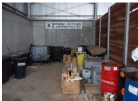
Nevarni odpadki gospodinjstev

»Mislim, da je za odpadke dobro poskrbljeno. Večkrat opazim ljudi, kako prinesejo odpadke na smetišče, zadovoljen pa sem z ureditvijo, saj je kup smeti pokrit z mrežo, zato jih veter ne raznese,« je povedal eden izmed stanovalcev v bližini smetišča. Drugi se je odzval drugače. Povedal je, da v bližini smrdi in da tu ni tako prijetno živeti. Dodal je še, da ne more v nikakršnem pogledu hvaliti smetišča.