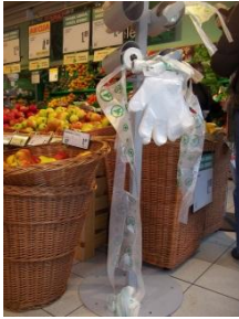
Sadje in zelenjava v trgovini v Trbovljah

Obiskala sem trgovino v Trbovljah. Ogledala sem si kupce in njihove nakupe. Sledila sem gospodu, ki se je najprej ustavil pri sadju in zelenjavi ter izbral pomaranče, solato in paradižnik. »Vsak konec tedna v tej trgovini nakupim živila in gospodinjske pripomočke,« je povedal opazovani gospod.