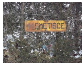
Smerokaz za smetišče

Na določene časovne termine se posode izpraznijo v tovarnjak Komunale Trbovlje in se odpeljejo proti Zbirnemu centru Neža. Ogovorila sem smetarja, ki je ravnokar praznil smetnjake. »Največkrat ne gledam vsebine smetnjakov, opazim pa, kako kdaj pa kdaj ob smetnjaku ležijo smeti vsepovprek,« je razložil. »Če bi si ti ljudje vzeli nekaj minut in odložili odpadke vsakega v svoj prostor, bi nam s tem olajšali delo.«